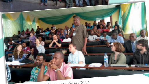
École de recherche à Ibadan (Nigéria) - 2017