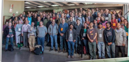
École de recherche à Buenos Aires (Argentine) - 2017

Les étudiants doivent candidater sur notre site internet. Le CIMPA finance les frais de voyage et de séjour de nombreux participants.