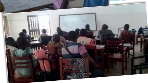
SFR à Dangbo (Bénin) - 2017