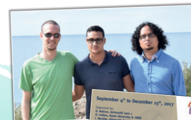
Les 3 lauréats du trimestre IHP du 4 septembre au 15 décembre 2017

Prises en charge des frais de voyage, d'hébergement et de repas pour toute la durée du trimestre.