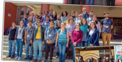
EMA à Ouaga (Burkina Faso) - 2016